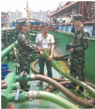
涉案嫌疑人给海警办案人员指认相关物品。

种种迹象表明,附近海域应该还有“漏网之鱼”。根据现场情况,江苏海警一方面将抓到的3艘嫌疑船押回码头,同时,继续前往相关海域展开